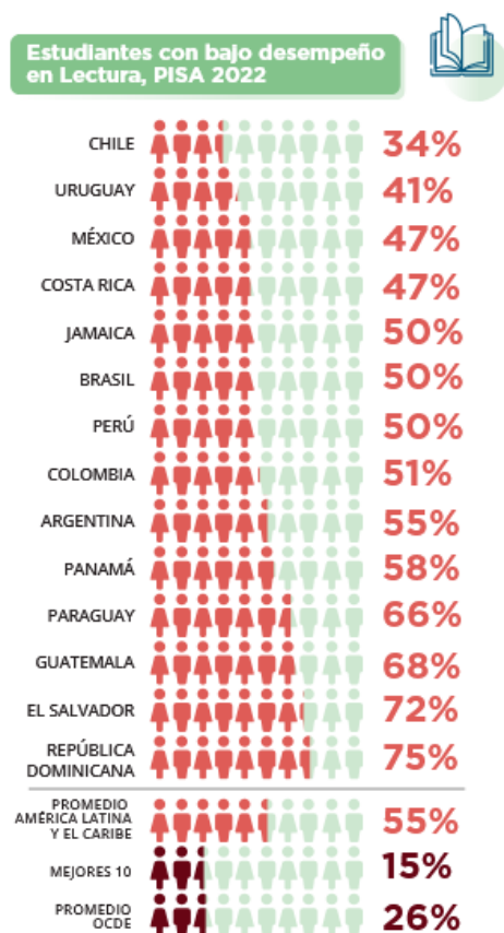
Figura 1. Porcentaje de estudiantes con bajo desempeño en lectura

Nota: OCDE (2023), PISA 2022, Vol. I, Table I. B1.3.2