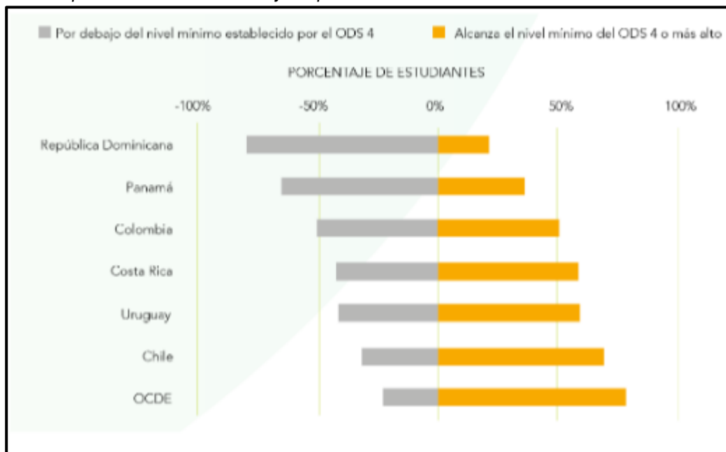
Figura 2. Porcentaje de estudiantes que alcanzaron el nivel mínimo establecido por ODS 4 y la OCDE en Lectura en los países latinoamericanos y los países de la OCDE.

Nota. tomado de PISA Panamá, Programa para la Evaluación Internacional de Estudiantes, pág. 7, elaborado por MEDUCA y OCDE, 2019. Disponible en https://www.oecd.org/pisa/pisa-for-development/Panama_PISA_D_National_Report.pdf